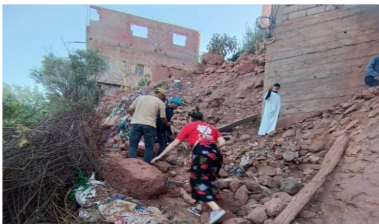
Figura21 : Caritas Marruecos en el lugar tras el terremoto.