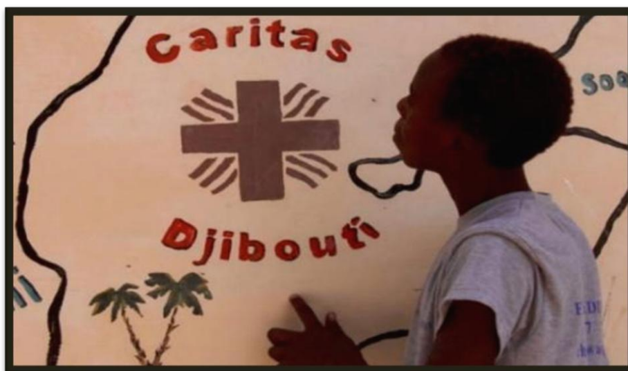
Figura13 : Primer logotipo de Caritas Yibuti

1978. Tras la independencia del país el 27 de junio de 1977, Caritas Yibuti se unió a la Confederación Caritas Internationalis y se separó de la organización francesa Secours Catholique . Sus objetivos incluían entonces iniciativas educativas, alivio de la pobreza, apoyo a refugiados y personas con discapacidad y proyectos de desarrollo sostenible, además de la creación de una red de voluntarios.