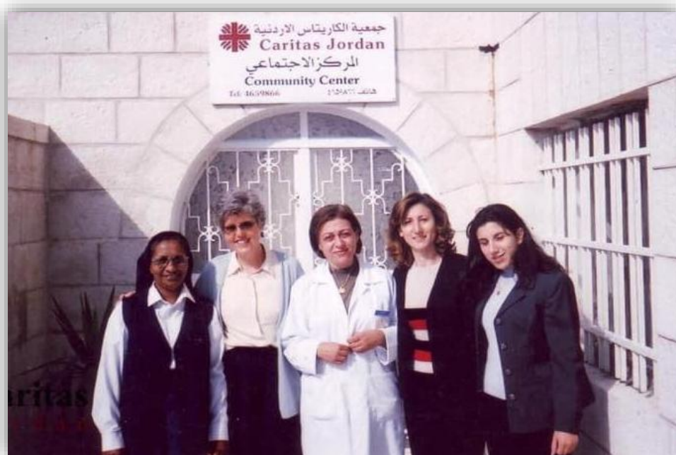
Figura10 : Caritas Jordania

↓ 1969. Caritas Egipto, Caritas Jerusalén y Caritas Jordania se afiliaron oficialmente a Caritas Internationalis durante la 8. a Asamblea General.