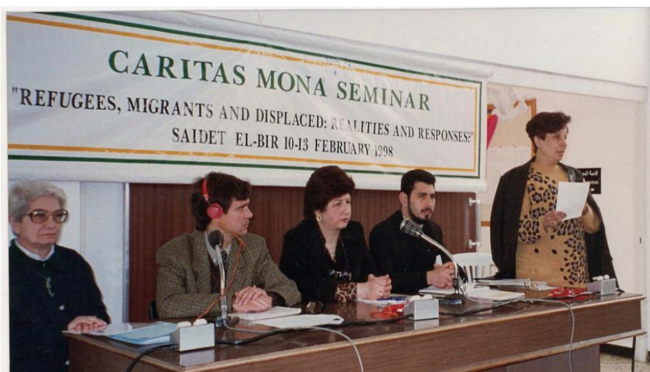
Figura3 : Seminario de Caritas MONA en 1998

Coordinador regional, de 1995 a 2003, en Beirut.