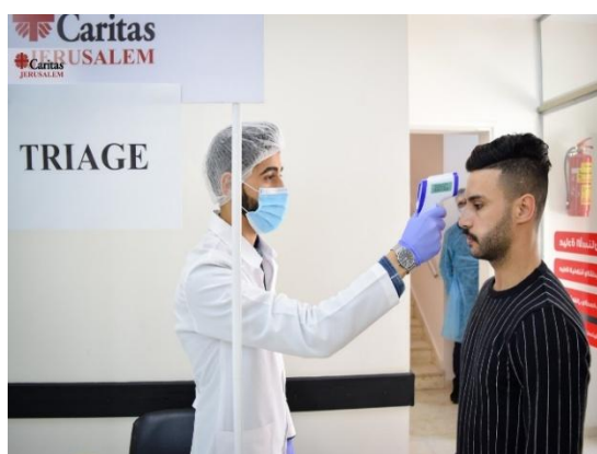
Imagen16 : Caritas Jerusalén prestando asistencia