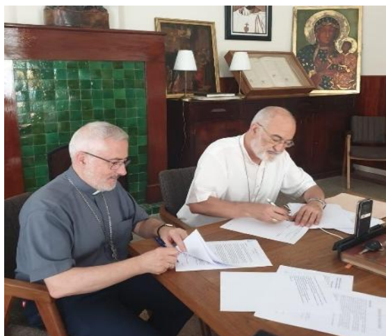
Figura22 : Firma oficial de los estatutos de Caritas Marruecos

También se obtuvo el reconocimiento administrativo y la validación legal por parte de las autoridades del país.