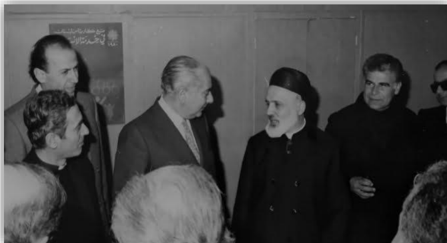
Figura12 : Funcionarios de Caritas Líbano con el patriarca en el Líbano

1976. El 9 de septiembre, Caritas Líbano fue aprobada oficialmente por la Asamblea de Patriarcas y Obispos Católicos del Líbano como el brazo sociopastoral de la Iglesia. Desde entonces, Caritas Líbano es miembro de la red Caritas Internationalis .