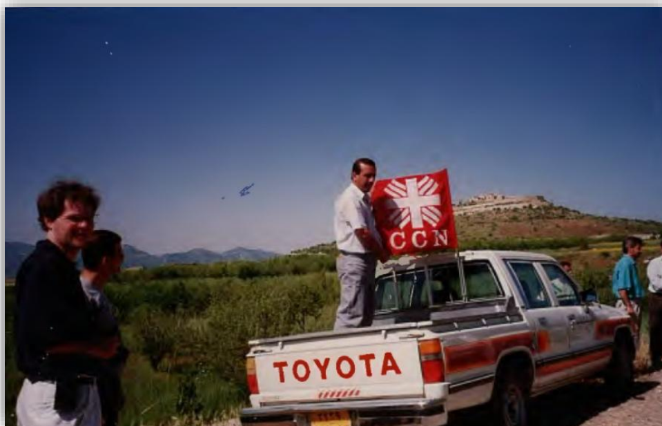
Figura14 : Equipo de Caritas Irak con la bandera del antiguo logotipo

• 1992. Se fundó Cáritas Irak en respuesta al embargo económico impuesto al país. Fundada por el Consejo de Obispos Católicos, la organización tenía como objetivo aliviar el grave sufrimiento de los iraquíes durante este difícil momento. Sus esfuerzos iniciales se centraron en un único programa: distribuir alimentos a través de las iglesias para ayudar a los pobres y necesitados.