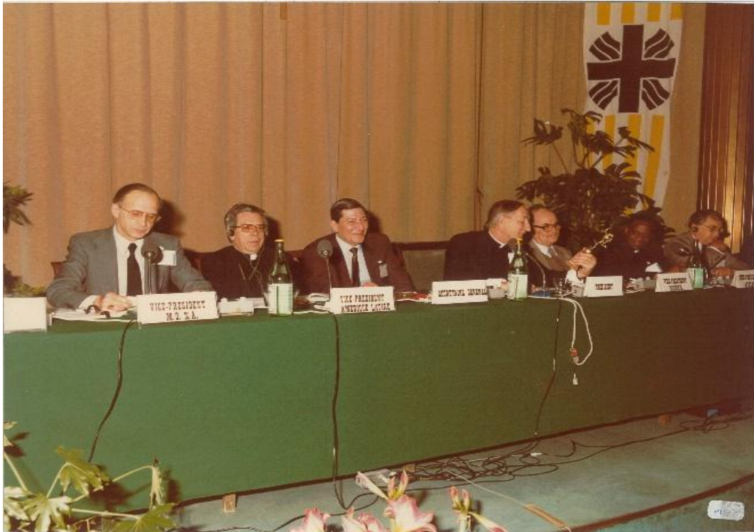
Figura2 : Mons. Teissier como vicepresidente de CI en la XI Asamblea General.

Esta configuración representa una oportunidad única para que Caritas exprese, «a través de acciones concretas, la naturaleza universal de la caridad cristiana», para «dar testimonio del significado evangélico de ser humano más allá de las fronteras visibles de la Iglesia» y para vivir el diálogo diario —o, mejor aún, los encuentros— entre cristianos y musulmanes.