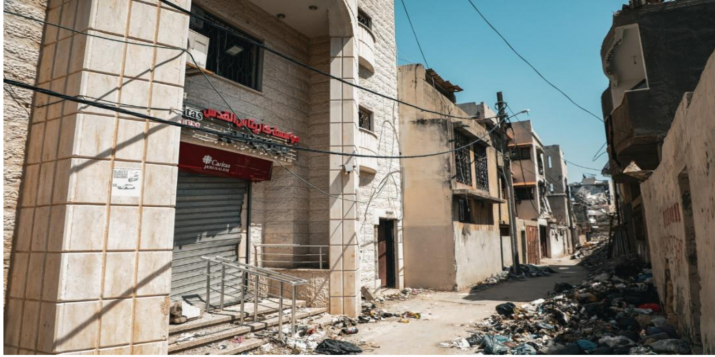
Figura23 : Oficina de Cáritas Jerusalén en Gaza

Lamentablemente, Caritas Jerusalén ha lamentado la trágica pérdida de dos miembros de su personal en Gaza.