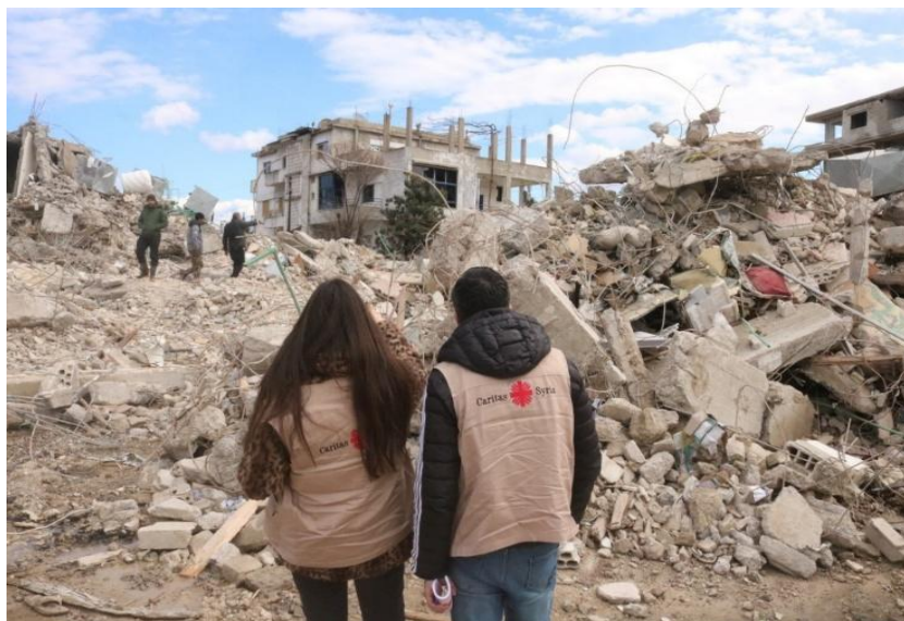
Figura20 : Caritas Siria en el lugar tras el terremoto.