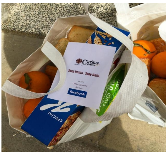
Imagen18 : Caritas Chipre entrega cestas de alimentos.

En el ámbito de la incidencia política, Caritas se centró principalmente en promover el acceso equitativo a las vacunas para todos.