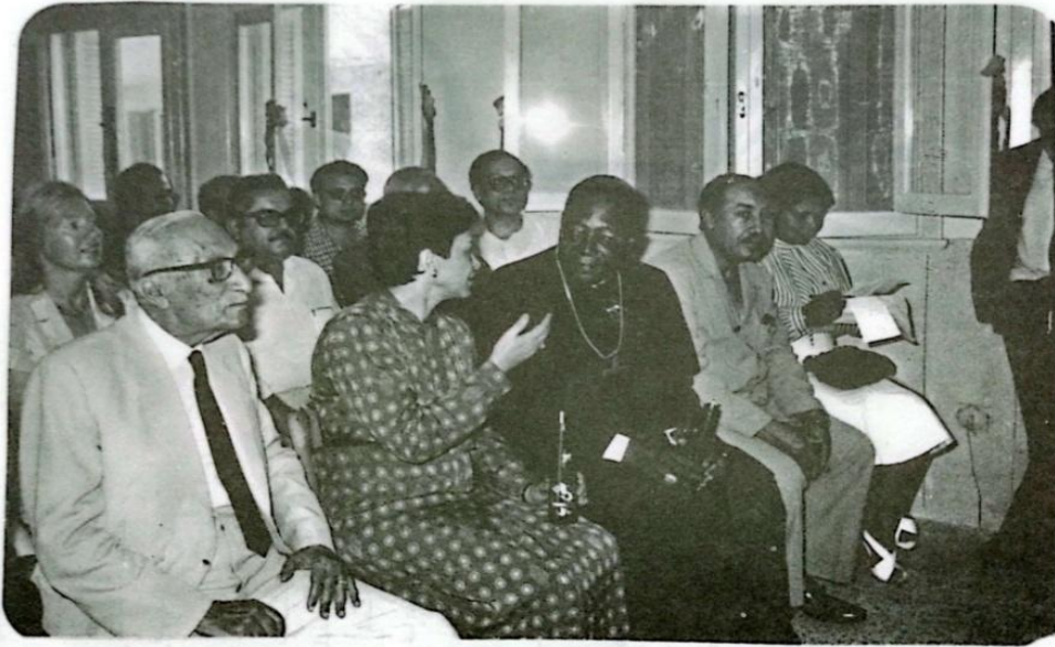
Figura9 : Caritas Egipto

↓ 1967. El 25 de noviembre se creó Cáritas Egipto , reconocida por el Ministerio de Solidaridad Social egipcio.