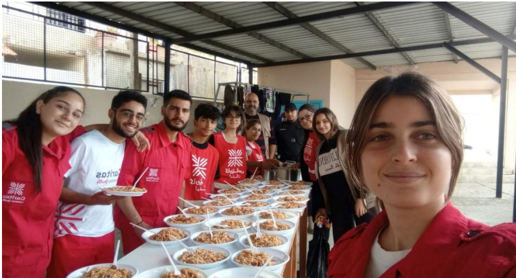
Figura24 : El equipo de Caritas Líbano proporcionando comidas a los libaneses que buscan refugio en el sur del Líbano

La guerra también se ha extendido a los países vecinos, concretamente al Líbano, lo que ha provocado enormes pérdidas humanas y materiales. Caritas Líbano ha respondido de forma inmediata a los refugiados libaneses del sur del Líbano.