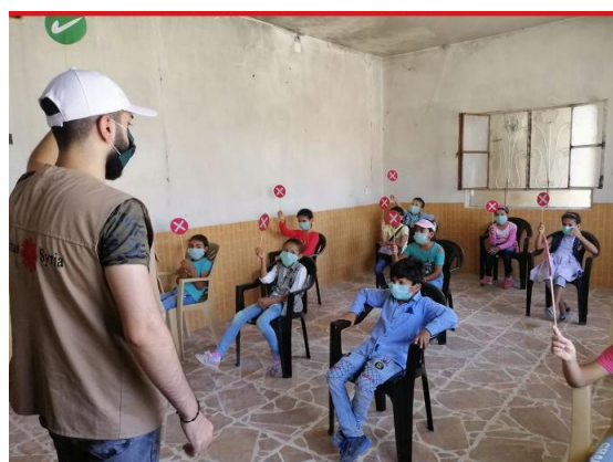
Figura15 : Caritas Siria imparte sesiones de sensibilización sobre la prevención de la COVID-19 a los niños.