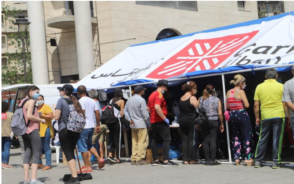
Figura19 : Carpa de Caritas Líbano en Beirut proporcionando alimentos y suministros médicos