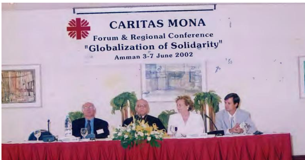
Figura4 : Foro y Conferencia Regional de Caritas MONA, 2002