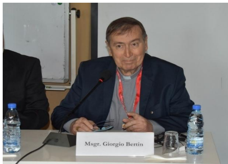
Figura 7 : El obispo Giorgio Bertin en la Conferencia Regional celebrada en Beirut en 2023