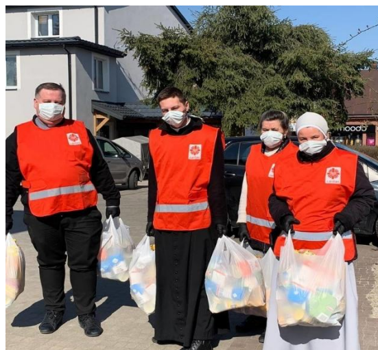
Figura17 : Caritas Jordania distribuyendo ayuda durante la COVID-19.