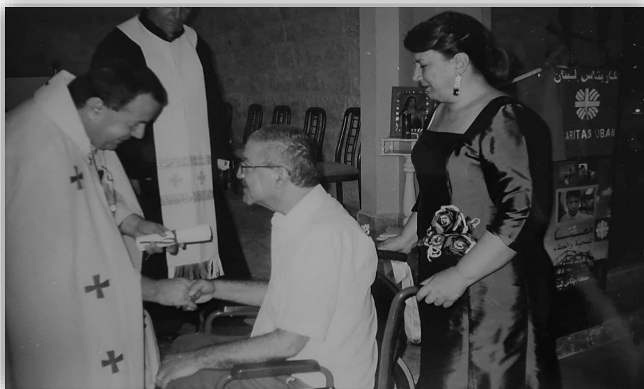
Figura11 : Caritas Líbano