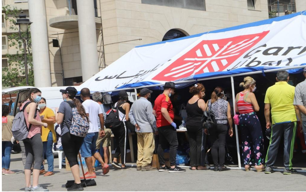
Image 20: Tente de Caritas Liban à Beyrouth pour fournir de la nourriture et des fournitures médicales

2020. Explosion à Beyrouth. Le 4 août, des explosions d'une ampleur inédite dévastent le port de la capitale libanaise en quelques secondes, causant plus de 200 morts, 6 000 blessés et environ 300 000 sans-abri. Caritas Liban intervient immédiatement via son unité d'urgence puis par des programmes d'assistance, avec le soutien des Caritas du monde entier.