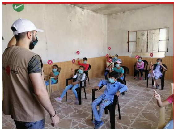
Image 16: Caritas Syrie organise des sessions de sensibilisation sur la prévention du Covid19 auprès des enfants.