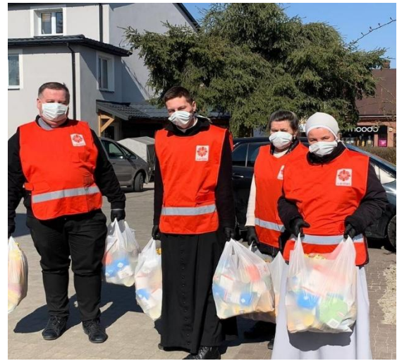
Image 19: Caritas Jordanie distribue de l'aide pendant le Covid19.