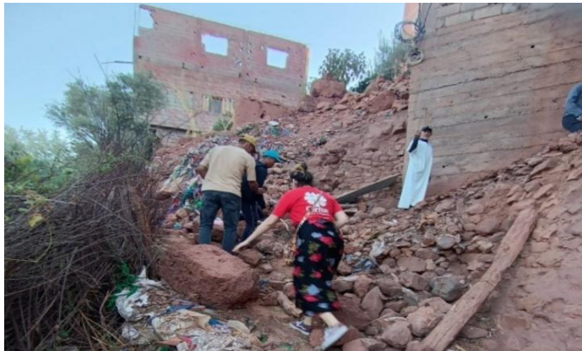
Image 22: Caritas Maroc sur le site suite au tremblement de terre.

↓ 2023. Tremblement de terre au Maroc. Le 8 septembre, un séisme frappe le Maroc, causant plus de 3 000 morts et de lourds dégâts, notamment dans les villages isolés du Haut Atlas. Caritas Maroc, en collaboration avec les paroisses, partenaires et bénévoles locaux, et soutenue par les Caritas Sœurs, lance une réponse rapide pour couvrir les besoins immédiats et de long terme : aide alimentaire, abris, WASH, ainsi qu'un accompagnement humain et spirituel.