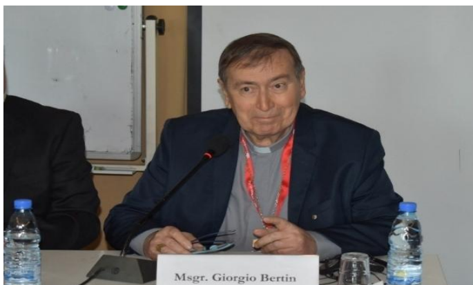
Image 8: Mgr Giorgio Bertin lors de la Conférence régionale de Beyrouth en 2023