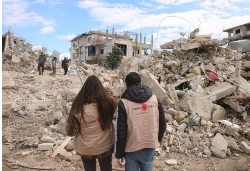
Image 21: Caritas Syrie sur le site après le tremblement de terre.

essentiels et un accompagnement à long terme, malgré les conditions difficiles. En solidarité, une équipe de l'unité jeunesse d'urgence de Caritas Liban se joint aux efforts en Syrie.