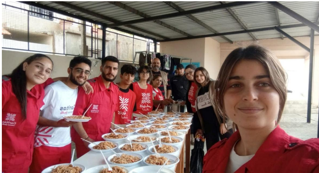
Image 25: L'équipe de Caritas Liban fournit des repas aux Libanais en quête de réfugiés du Sud-Liban

La guerre s'est également étendue aux pays voisins, en particulier au Liban, entraînant des pertes humaines et matérielles massives. Caritas Liban a apporté une réponse immédiate aux réfugiés libanais du Sud-Liban