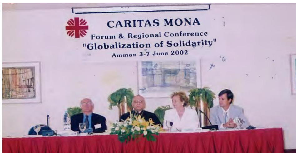
Image 4: Forum et conférence régionale de Caritas MONA, Amman, 2002